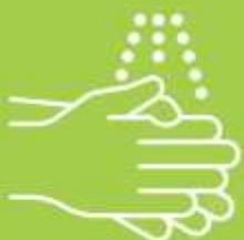
Lavage des mains

La plupart des demandes seront transmises à Basingstoke Voluntary Action pour organiser le soutien local d'un centre communautaire, par exemple la livraison de nourriture.